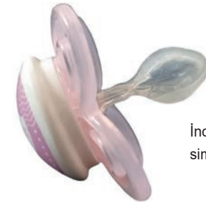
İnce ağızlıklı simetrik emzik