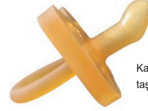
Kalın ağızlıklı kiraz taşından emzik