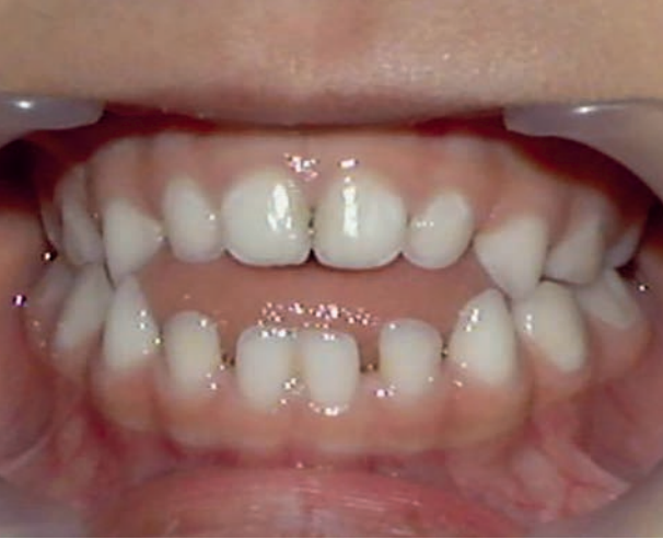
Yoğun emzik kullanımı sonucu öne doğru aralıklı gelişmiş ön dişler

Emziğin uzun süre boyunca çocuğun ağızında kalması, diş ve çene bozukluğu oluşumunu tetiklemektedir. Bunun sonucunda görülen tipik bir diş ve çene bozukluğu ise ön dişlerin öne doğru aralıklı şekilde gelişmesidir.