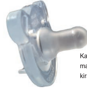
Kalın ağızlıklı ve sağlam malzemeden üretilmiş kiraz taşından emzik